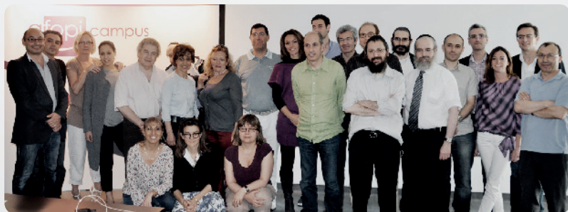
Promotion après remise des diplômes, juin 2011

L'AFOP vous transmettra toute son expérience dans la pure tradition du compagnonnage de la chirurgie française. A l'issue du cursus suivi à l'AFOP, 94% des participants pratiquent régulièrement l'implantologie et ceci en toute sérénité.